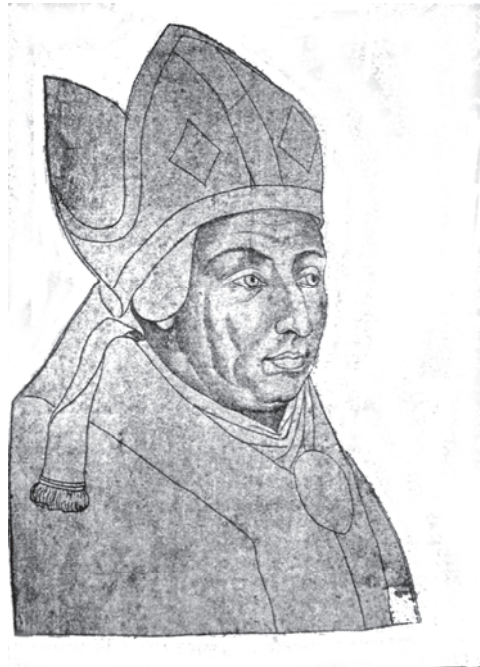
David van Bourgondië, bisschop van Utrecht van 1456 tot 1496, die op 6 april 1457 in een brief de stadsrechten van Baarn bevestigde. Tekening door Jeroen Bosch of Jacques Leboucq, uit een collectie in de abdij St. Vaast te Atrecht

worden voor de bouw van een stenen romano-gotische kerk, de kern van de tegenwoordige kerk op de Brink. In de tweede helft van de veertiende eeuw, toen iedere inwoner geacht werd roomskatholiek te zijn, viel de burgerlijke 'gemeente' samen met de parochie. Baarn kreeg het stadsrecht van Utrecht, dat zelf al omstreeks 1120 stadsrechten verwierf. Utrecht is de moederstad voor alle steden van het Nedersticht,