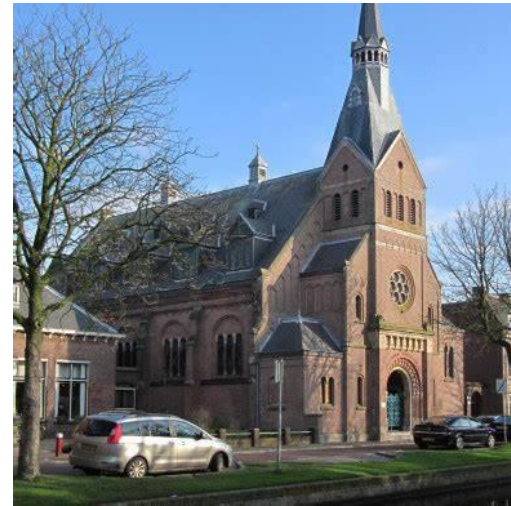
Van Houtenkerk, Weesp

Toegangsprijs bezoekers 13 jaar en ouder €6,00, bezoekers t/m 12 jaar €1,00