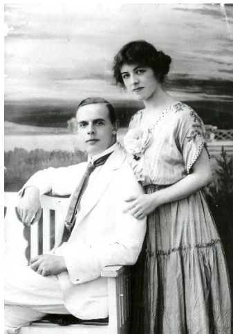
De ouders van Hella Haasse

Tijdens een van mijn bezoeken aan de Nieuwe Begraafplaats vertelde de beheerder mij een eigenaardig verhaal over het graf van een andere beroemde Baarnse familie: Haasse. In dat graf liggen de grootouders en ouders van de schrijfster Hella Haasse begraven. Toen de vader van Hella Haasse in 1955 overleed werd hij op begraafplaats Driehuis Westerveld gecremeerd. Op zijn urn werd een grafkei geplaatst. Op zowel de urn als de kei werd een bronzen vignet bevestigd, ontworpen en gemaakt door zijn vriend, de beroemde Baarnse kunstenaar M.C. Escher.