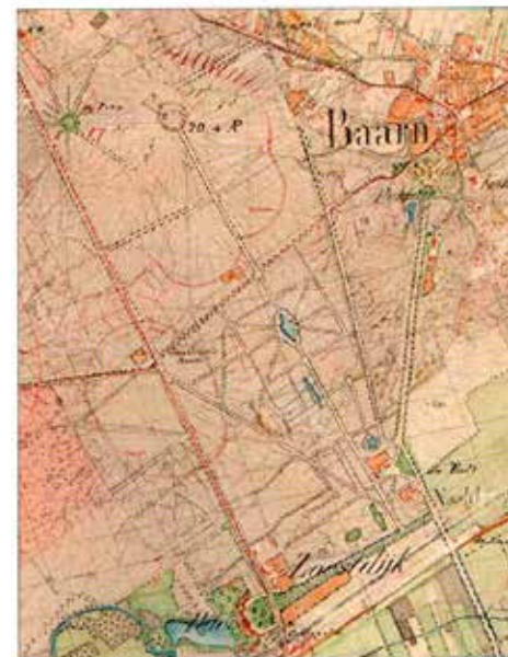
Afb. 14. Kaart van 1847 (Het Baarnse Bos, een vorstelijk wandelpark, p. 74)