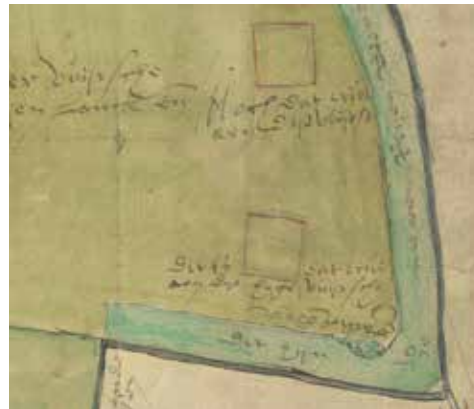
Kaart 3: Fragment van een schetsmatige kaart van De Vuursche, ruim omstreeks 1600, noorden rechts (Nationaal Archief, 4.VTH-3018). 'Noch Dat erve aen Dije Vuijrse' (boven) en 'Dit is dat Erve aen Dije hoge Vuijrse' niet ver van de galgenberg rechtsonder.

teksten bij de twee vierkanten, waarmee aannemelijk wordt dat de beide hofsteden zijn bedoeld: Noch Dat erve aen Dije Vuijrse , respectievelijk Dit is dat Erve aen Dije hoge Vuijrse . Het is speculeren welke de Oude Hofsteede uit 1359 is, maar men ontkomt niet aan de indruk dat de Oude Hofsteede de voorganger was van De Roskam door 'nog dat erf van De Vuursche'.