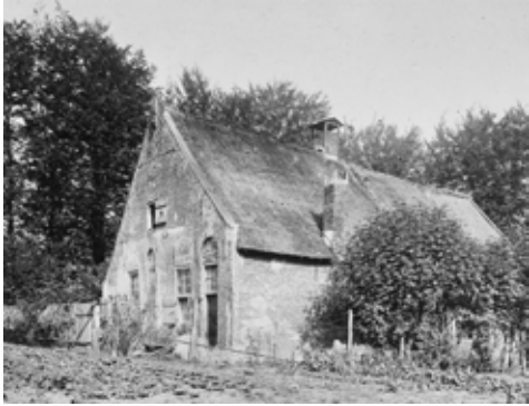
Afb. 5: 'Oude boerderij op De Vuursche', De Zeven Linden gefotografeerd in mei 1915.

kenshok en niet te vergeten de schaapskooi.' Aldus de Baarnsche Courant.