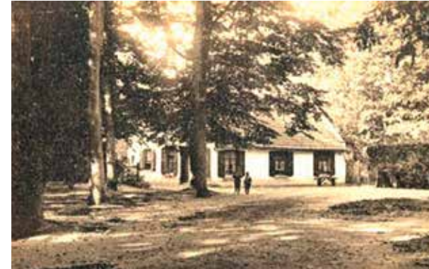
Afb. 11. Het witte huisje