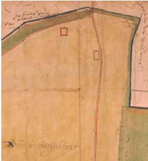
Kaart 2: Fragment 'Die Veurse Heerlijkheit, Ao 1597', noorden boven (Nationaal Archief, 4.VTH-3018). Drie rode rechthoeken, van boven naar beneden: een huis bij de kruising en de voorgangers van De Roskam en De Zeven Linden.