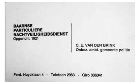
Afb. 7. Naamkaartje

Eens had een inbreker zich bij villa 'Hoog Wolde' verstopt onder het trapje bij de voordeur en zat daar te wachten totdat de nacht-