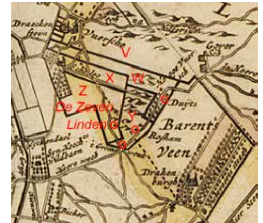
Kaart 4: Fragment van een kaart van Romeyn de Hooghe, 1690 (Het Utrechts Archief, rode tekst door auteur). Hierop staan 't Groenewout', 'Roskam' en 'Duijts' aangegeven. Deze huizen zijn rood omcirkeld. Noorden rechts.