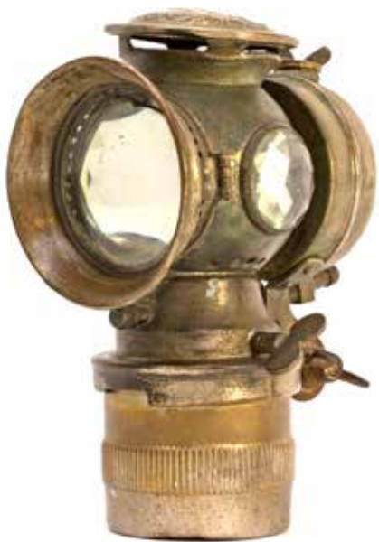
Afb. 5. Carbidlantaarn (internet)

Om de huizen te belichten had hij in het begin een carbidlantaarn bij zich, later werd dat een zaklantaarn.