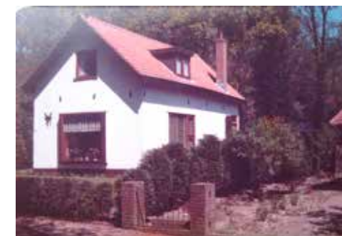
Afb. 2 en 3. Het huis op de Ferdinand Huycklaan vóór en na 1956