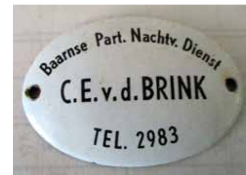
Afb. 4. Schildje

was en over de loods achter wat nu Eethuyscafé 'De Generaal' is. Die loods was toen een opslagplaats van Philips. De fabriek aan de Torenlaan, waar de grammofoonplaten gemaakt werden, had geen beveiliging nodig, want daar werd dag en nacht gewerkt. Van den Brink zal ook langs zijn eigen kiosk aan de Amsterdamsestraatweg gegaan zijn. Op de muur van de gebouwen die hij beveiligde, was een schildje aangebracht, waaraan men kon zien dat daar gewaakt werd.