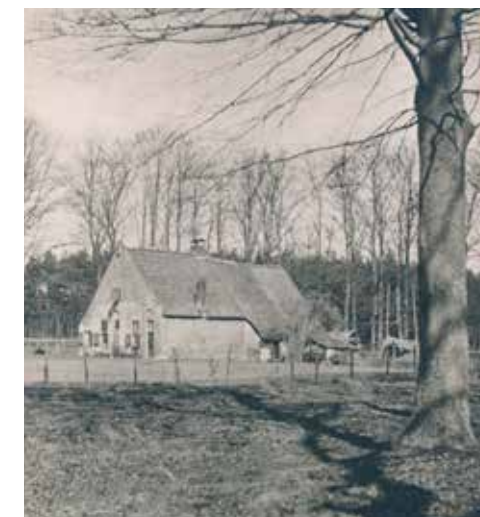
Afb. 4: 'De Zeven Linden' binnen het carré van beuken en de voorgevel naar het zuidwesten, gefotografeerd omstreeks 1900-1910.

Deze herberg heeft naar mijn volle overtuiging bestaan ten zuiden van de oude weg, daar