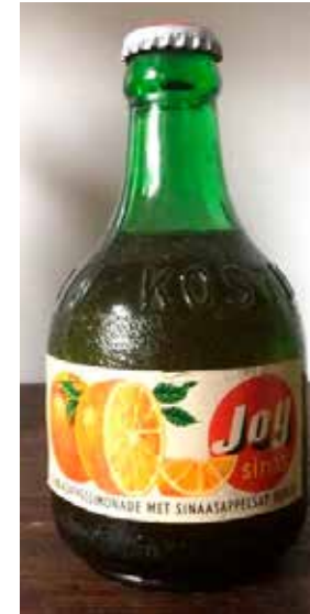
Afb. 19. Flesje Joy (internet)

De kiosk had een wc, de enige in de wijde omgeving, en dan met al die mensen. Om de haverklap was die ook vreselijk smerig en het was onder andere de taak van de dochters om de