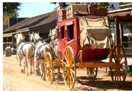
Afb. 15. Diligence