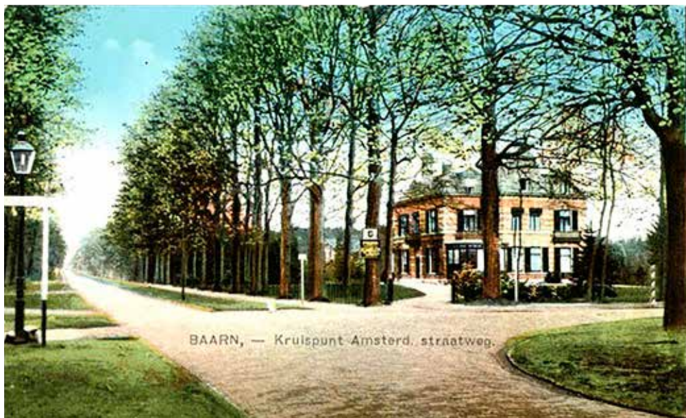
Afb. 13. Kruispunt Amsterdamsstraatweg en Van Heutszlaan/Oranjeboomschestraatweg met villa Roosterhoeck.