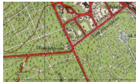
Afb. 10. Kruispunt bij De Oranjeboom (www.topotijdreis.nl 1953)

Bij het kruispunt De Oranjeboom op de hoek