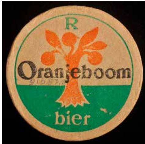
Afb. 16. Bierviltje van Oranjeboom bier (internet)

en buiten zijn landgoed De Eult.) Dat die straat deze naam had, heb ik nog nergens verder gevonden! Hoe komen ze daar aan? Je zou toch mogen aannemen, mocht hier echt ooit een boom geplant zijn met de naam Oranjeboom, dat dan was vanwege de Oranjes die in het paleis verbleven.