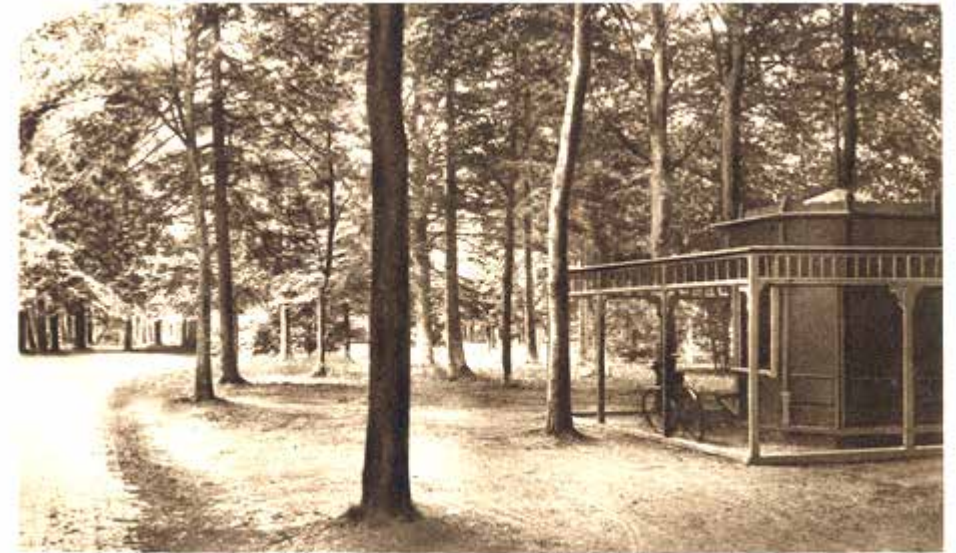
Afb. 17 De kiosk voor de oorlog

In het boek Duizend Jaar Baarn (p. 47) staat in het artikel van Jaap Groeneveld een kaart afgedrukt met tijdlagen, zoals hij dat noemt. Daarop kan je aflezen dat de Amsterdamsestraatweg