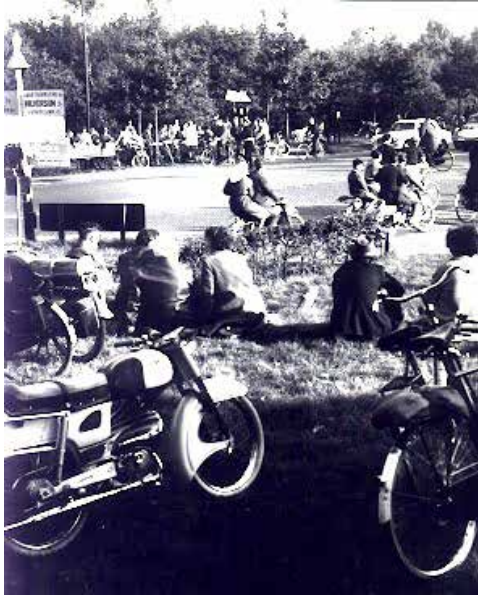
Afb. 9. Het drukke kruispunt (internet, Geheugen van Baarn)

Amsterdam naar Amersfoort. Naarmate het autoverkeer in de twintigste eeuw toenam, werd dat een steeds drukker weg en ook een heel druk kruispunt. En dat gaf veel bekijks, want dat was nieuw. Daar is al veel over geschreven, zoals op 27/5 2015 door Erik van der Ent in de Baarnsche Courant. Het gaat over die drukte, het bermtoerisme, de talloze ongelukken vaak meerdere keren op een dag, en de twee verkeersagenten, die dat drukke verkeer in goeie banen moesten leiden met een 'omklapbaar' verkeersbord.