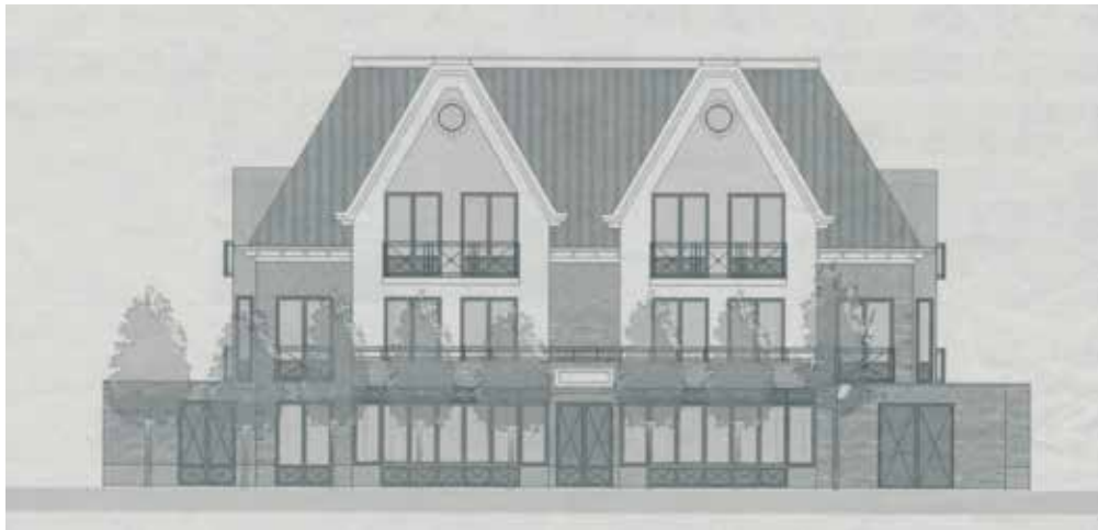
Afgekeurd plan 2016.

In 2015 pakt de zoon van Brouwer het project weer op, nu met 6 appartementen in 3 bouwlagen, voor de doelgroep senioren. Ondanks