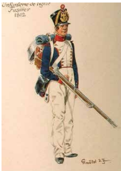
Fuselier, getekend door Richard Knötel (ca. 1890)

In gesprekken in kleine kring hoor je soms zeggen dat een voorouder ook in het leger van Napoleon gediend heeft en al of niet is teruggekeerd. Sinds kort is het mogelijk na te gaan bij welke eenheid die militair was ingedeeld.