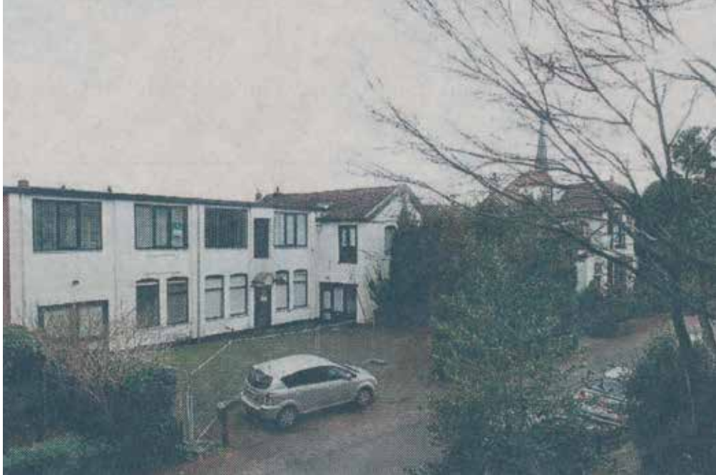
Leegstaand bedrijfspand Kampstraat 2B.

het meer klassieke uiterlijk van dit bouwplan, waardoor het complex beter in het straatbeeld zou passen, blijven de omwonenden strijdlustig.