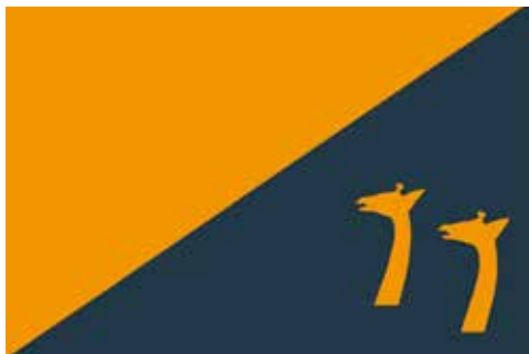
Vlag van De Giraffes.