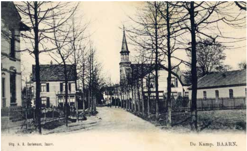
De Kampstraat rond 1900 met rechts al een bedrijfspand op de latere locatie van GBE.

polijstbedrijf in de Kampstraat. Vanaf de jaren 1920 was op die locatie een timmerwerkplaats voor tuinonderkomens als kassen en loodsen van G. Koelewijn gevestigd. In 1953 kwam er een brommerfabriek.