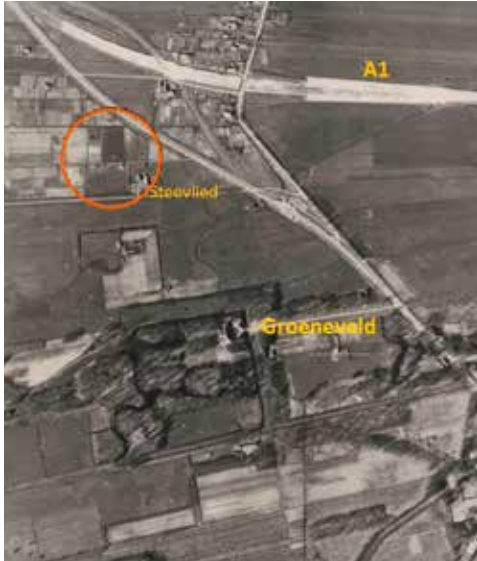
Ligging van de velden achter het later afgebroken Steevlied op een RAF luchtfoto uit 1945.

gaww bleek het handiger om het clubblad per wijk aan huis te bezorgen, waarbij aan de bezorger werd betaald. Omdat het clubblad maar eens in de twee weken verscheen, hing er een publicatiebord in de gymzaal.