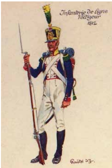
Voltigeur, getekend door Richard Knötel (ca. 1890)