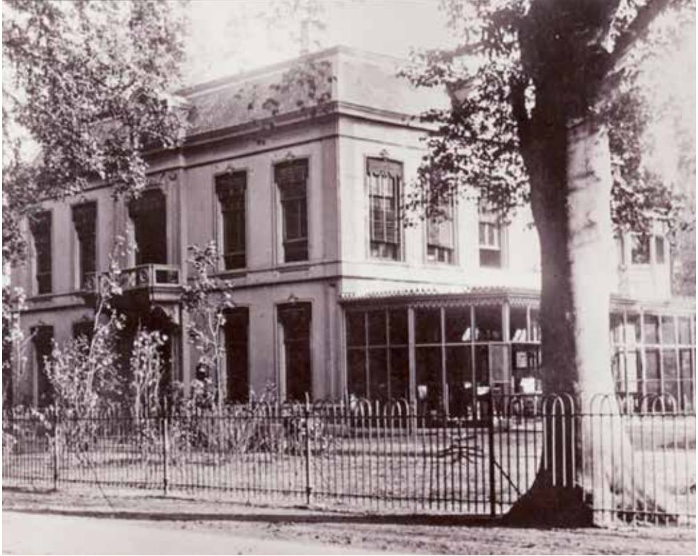
De villa rond 1900 in oude glorie.