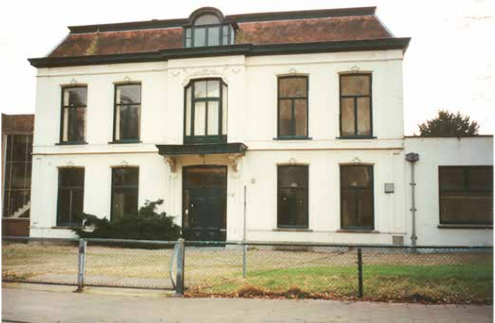
De leegstaande villa rond de tijd van de sloop in de jaren 1970.

(beide 800 tonners) in Batavia op hun naam geregistreerd. De firma exporteerde voornamelijk naar Noord-Amerika, maar ook naar Amsterdam via commissienair Van Eeghen.