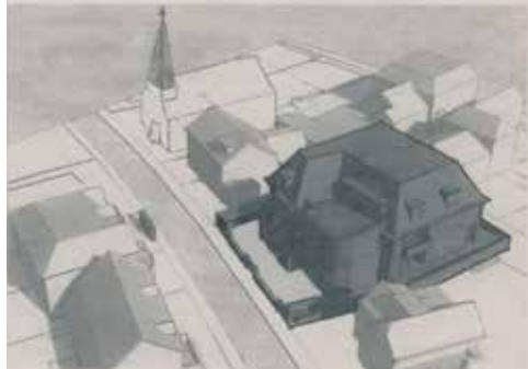
Afgekeurd plan 2009.

Met het sluiten van GBE keert de rust tijdelijk terug. Het bedrijfspand dient vervolgens een twintigtal jaren als bedrijfsverzamelgebouw. Totdat er in 2009 plannen voor de bouw van appartementen openbaar worden gemaakt en