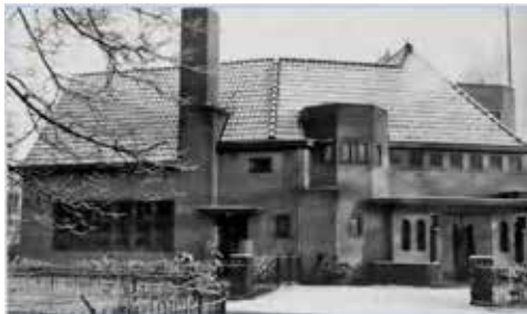
Gebouw van Christelijke Belangen.