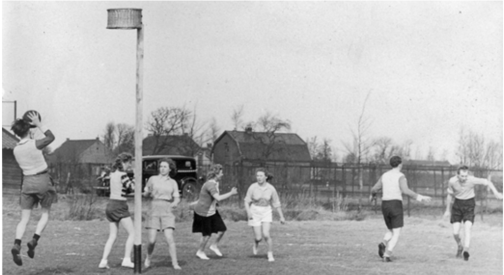
Giraffes 2 – Samos 3 op 20 maart 1949 aan de Zandvoortweg.