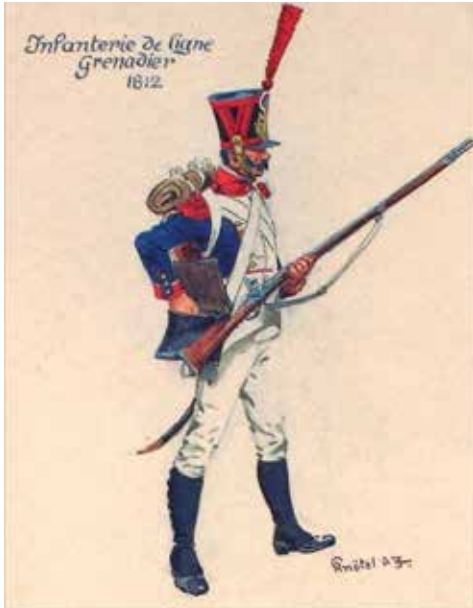
Grenadier, getekend door Richard Knötel (ca. 1890)