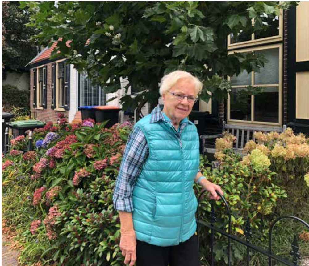
Greet voor Acacialaan nrs. 32 en 34.