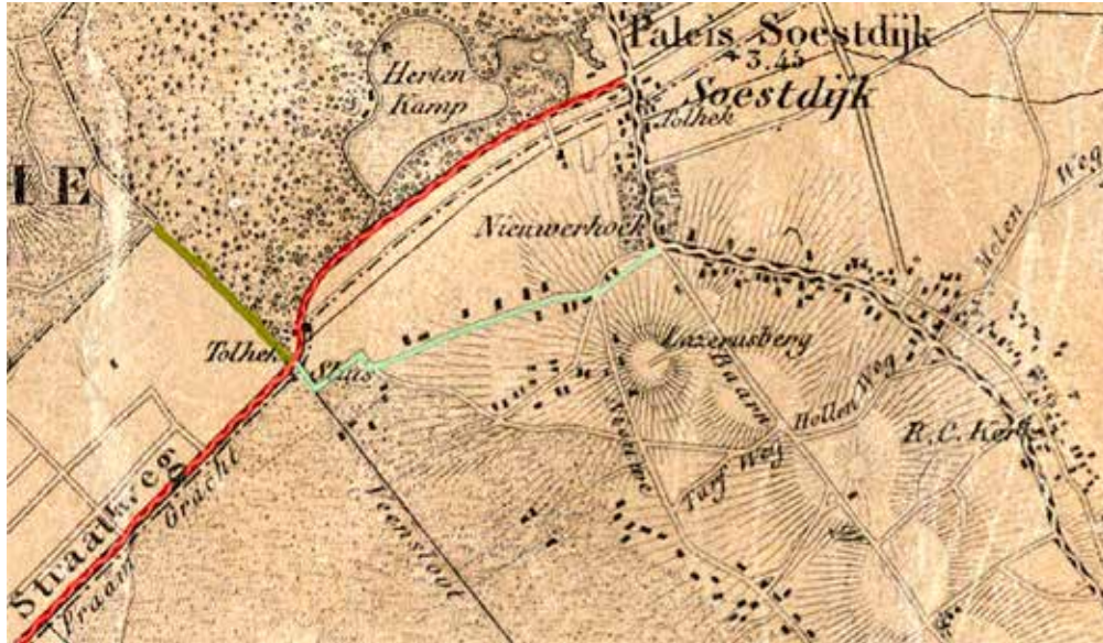
Uitsnede uit de provinciekaart van Utrecht (1850), samengesteld en getekend door A.A. Nunnink onder toezicht van J.H. Kips. De afbeelding toont onder andere het noordelijk deel van de straatweg van Soestdijk naar De Bilt (rood gemarkeerd), met ten zuiden van de bochten de Veenhuizer tol. Van Soestdijk uit gezien voor de tol links de Veenhuizerweg (lichtgroen), rechts de Hessenweg (mosgroen) (RHCR, A1176).

ting De Bilt dat vlak voor de tolboom linksaf zou slaan, de Veenhuizerweg in. Als die tolboom zou moeten verdwijnen, wilde hij een korting van fl. 400,- per jaar op de pachtsom. Die kreeg hij niet en de tolboom bleef staan tot het begin van de volgende pachtperiode. Toen De Bruijn de opbrengst van de tolgelden voor nog eens drie jaar pachtte, stond in de voorwaarden dat er geen tol geheven mocht worden van het verkeer op de Veenhuizerweg. De tolheffing op die weg werd per 1 januari 1901 dan ook beëindigd.