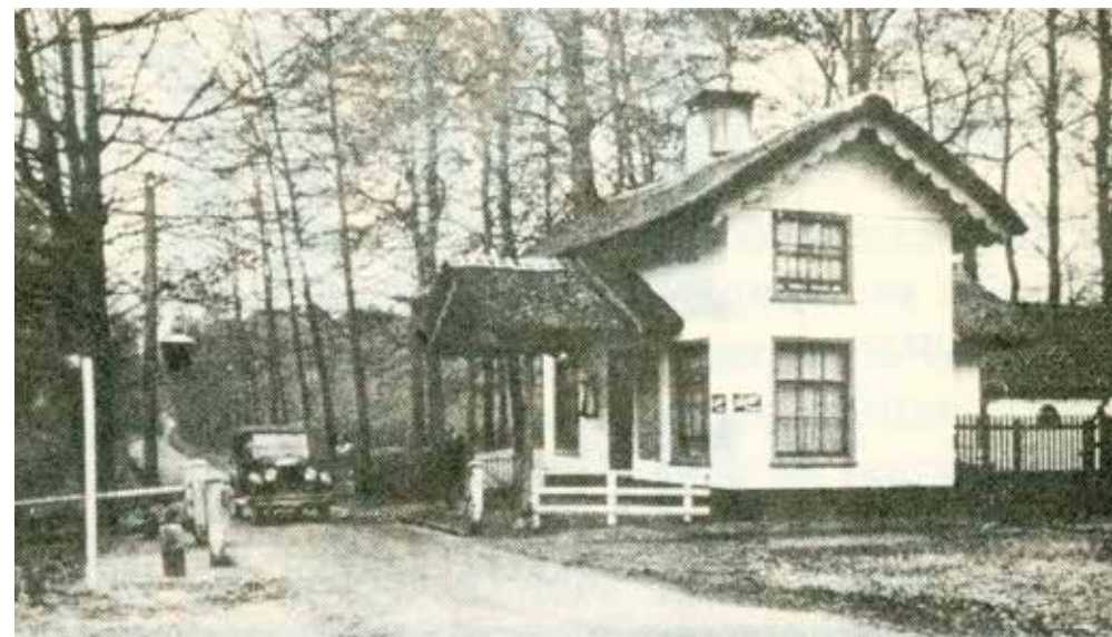
Tolhuis aan de Veenhuizer tol. Vanaf 1900 moest het gemotoriseerd verkeer ook tol betalen. (BC d.d.13-02-1995).