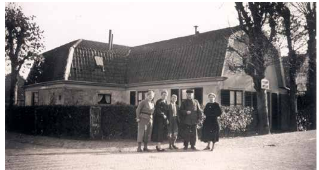
Boerderij hoek Acacialaan-Zandvoortweg.