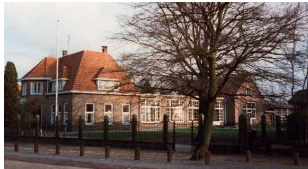
Kleuterschool Lenteleven.