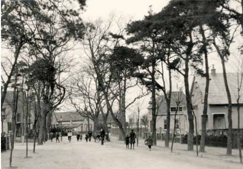
Acacialaan, met links de afslag Heuveloordstraat (HKB).

Toen ik wat ouder was, zette mijn moeder me in Amersfoort op de trein, vroeg aan medereizigers een oogje op mij te houden en in Rijssen stond de familie mij op te wachten. Dat ik alleen met de trein reisde vond ik niet erg. Ik was wel avontuurlijk en dacht "dat kan ik wel". Ik heb altijd contact gehouden.