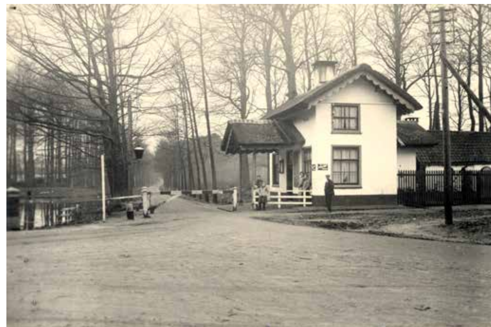
Het Veenhuizer tolhuis, kijkend in de richting van De Bilt. Voor de tol links de Veenhuizerweg (verhard), rechts de Hessenweg (onverhard). Datering 1924-1928.