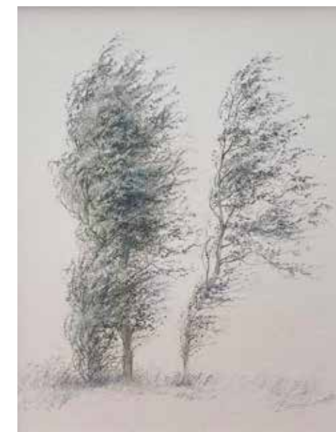
Bomen in de Eemnesserpolder (HKB).