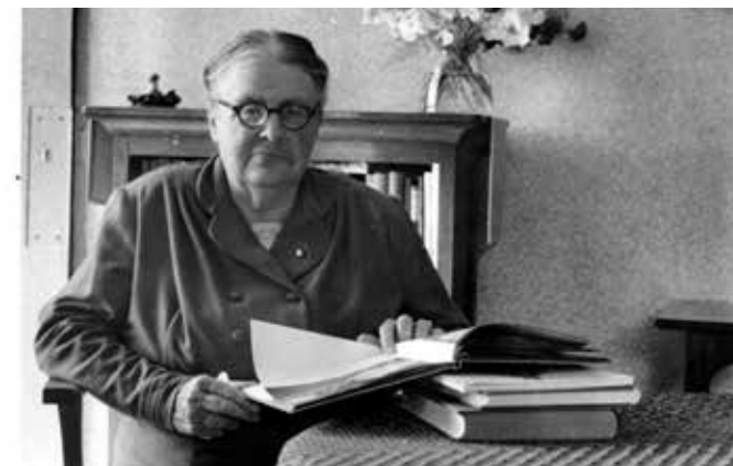
Prof.dr. Johanna Westerdijk