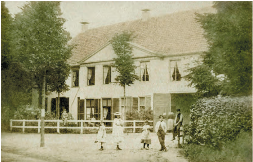
Hotel Ubbink rond 1875 (coll. Archief Eemland).

er jaarlijkse openbare verkopeningen van verschillende soorten hout (eiken, sparren, kastanje, iepen, beuken) dat uit het onderhoud van de Domeinen beschikbaar was gekomen. Er vond ook de driejaarlijkse verpachting plaats van de tollens van doorgaande wegen in de omgeving van Baarn, Soest en Eemnes: de Veenhuizertol, de Tol in de Birk en aan de weg naar Soesterberg in Soest, bij Groeneveld in Baarn maar ook die bij Huizen, Blaricum en Naarden. De opbrengst was voor de eigenaren van de wegen, die daarvan het onderhoud konden betalen. Er werd echter nogal vaak geklaagd over de toestand van de wegen en het gebrek aan onderhoud. Deze dienstverlening door de familie Ubbink gold ook voor diverse