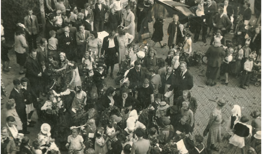
Bevrijdingsfeest op de Oosterhei.