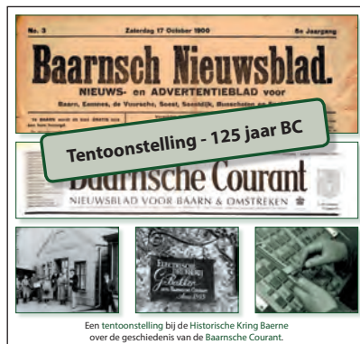
Een tentoonstelling bij de Historische Kring Baerne over de geschiedenis van de Baarnsche Courant.

Als de overheid het licht op groen zet, is de Oudheidkamer weer als vanouds geopend op woensdag van 14.00 tot 16.00 u en zaterdag van 11.00 tot 13.00 u. Op onze website historischekringbaerne.nl vindt u het laatste nieuws omtrent de bezoekbaarheid van de Oudheidkamer.