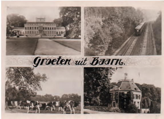
Kaart met meer dan één afbeelding; het is merkwaardig dat er twee afgebeelde plekken bij zijn, die ook elders in ons land te vinden waren. Uitg. Warenhuis 1001, Baarn, poststempel 1941.

het toenemende toerisme en goedkoper geworden druktechnieken was het lonend om voor toeristen kaarten te vervaardigen met afbeeldingen van dorpen en steden, het leven daarin en de omringende natuur. In circa 1880 liet boekhandel Koster in Amsterdam als eerste briefkaarten drukken met foto's of tekeningen van delen van dorpen en steden en hun omgeving. In ruimte voor een geschreven tekst op zo'n kaart was niet voorzien: de hele voorzijde bevatte een of meer afbeeldingen, de hele achterzijde was bestemd voor adressering. Als afzenders iets aan geadresseerden wilden schrijven, deden ze dat onder, op of om de afbeelding heen