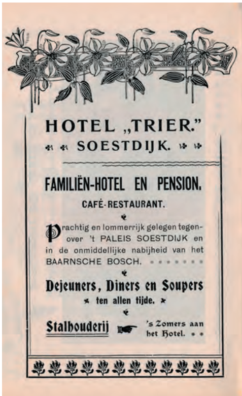
Advertentie uit Woninggids Baarn 1901 (coll. HKB).

op Soestdijk een grootse uitstraling te geven, zoals hij dat ook had gedaan met zijn hotels in de Kalverstraat in Amsterdam ('t Poolsche Koffiehuis en Suisse). Al snel na de overname in november 1897 wordt er melding gemaakt dat de keuken een aantal weken dicht zou gaan, vanwege de verbouwing van het hotel. Voor een drankje en voor bijeenkomsten blijft het hotel geopend. Op 10 april 1898 wordt Hotel Trier na een grondige opknabbeurt en 'ingericht aan de eischen van den tegenwoordigen tijd' heropend.