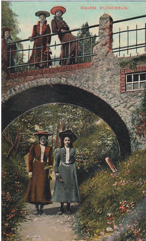
Stenen bruggetje over het pad naar de overgang van het spoor. Uitgave J.F. van de Ven, Baarn.

moeten worden gehaald. Soms staat er Groet uit Baarn of Groeten uit Baarn voorop een Ansichtkaart.