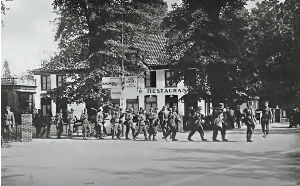
Militairen bij Hotel Trier, mei 1945.