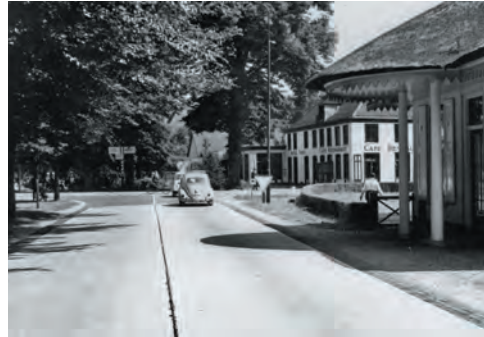
Het kruispunt met het hotel en het tolhuisje aan de Biltseweg in 1962.

vrijding heeft Hotel Trier een bijzondere rol vervuld. Op het kruispunt bij het hotel werd op 7 mei 1945 de overgave van de Duitsers bekrachtigd aan de 49th (West Riding) Infantry Division. Militairen van de 13e Britse Polar