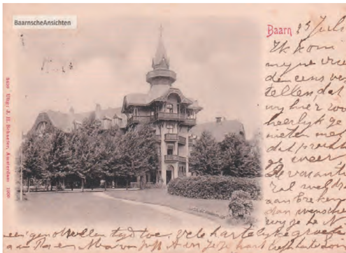
Het Bad-Hotel aan de Julianalaan, uitg. J.H. Schaefer, Amsterdam, 1900.

De ansichtkaart (genoemd naar de Duitse Ansichtpostkarte ), ook wel ansicht of prentbriefkaart genoemd, ontstond aan het eind van de 19e eeuw. Door