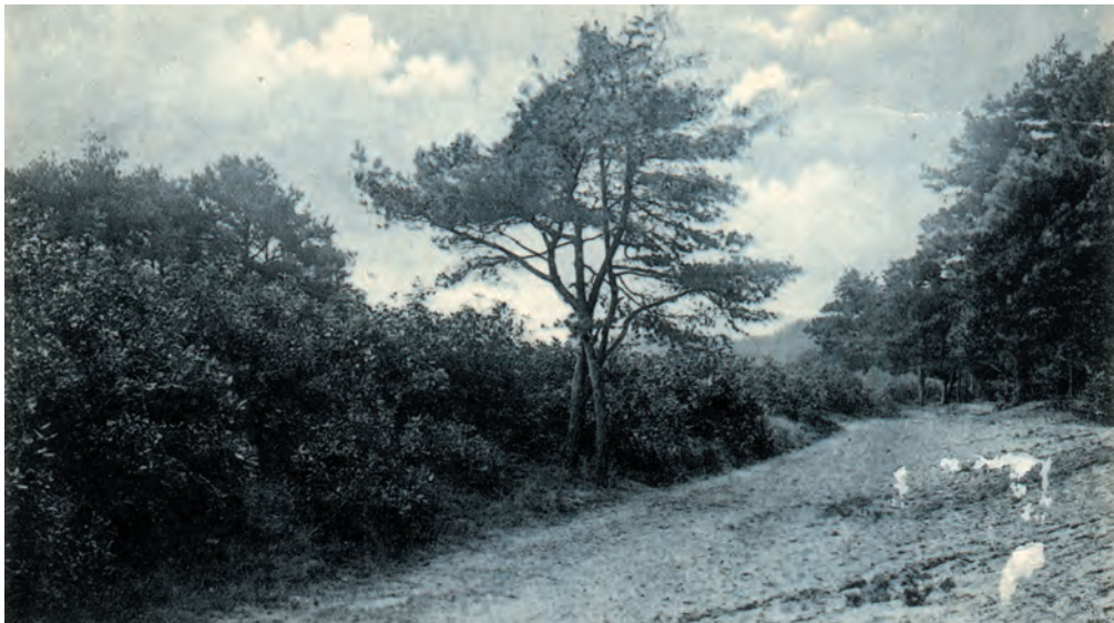
't Oosterbosch, rond 1900, waar later de Sparrenlaan is aangelegd.