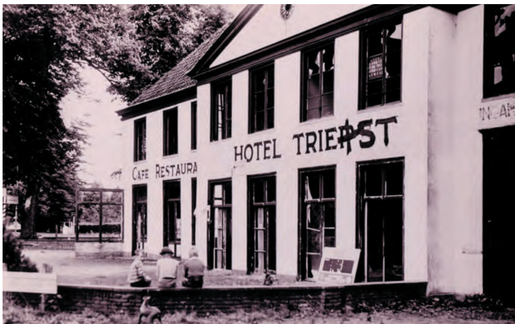
'Hotel Triest' in 1963.