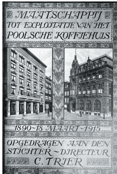
Tegeltableau geschonken door het personeel bij het 25-jarig jubileum van het hotel aan het Rokin in Amsterdam.