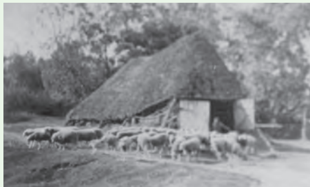
Schaapskooi op de plaats van de Nieuwe Algemene Begraafplaats, ca. 1910.

Voor 1800 was de Baarnse hei een klein onderdeel van de enorme heidevlakte die zich uitstreckte tussen Amersfoort en Huizen. Schapenteelt was het belangrijkste middel van bestaan. Langs de Oosterstraat neemt de bewoning vanaf 1850 toe. Deze straat is van oudsher een route naar de heidegronden ten zuiden van Baarn en liep via de Schapendrift (nu Kerkstraat) over de Noorderlaan (tegenwoordig Faas Eliaslaan) en de Noorderstraat. Intensivering van