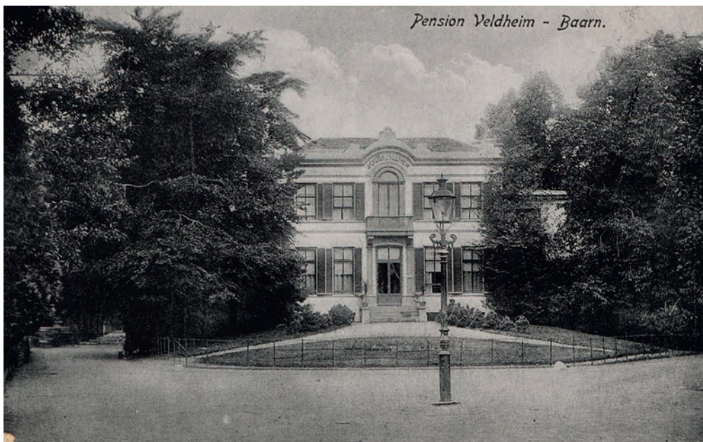
Huize Veltheim in de tijd dat het als pension in gebruik was, ca 1910-1920