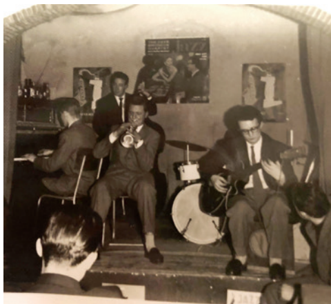
Opening van de Baarnse Jazzclub met jazzoptreden in Intiem in 1957

Vanaf het eind van de Tweede Wereldoorlog werden er overal in Nederland jazzclubs opgericht: met de komst van de Amerikaanse bevrijders werd ook de jazzmuziek (opnieuw) populair in Nederland. Met name in de grote steden richtten enthousiaste muzikanten jazzclubs op waar livemuziek werd gespeeld, vaak in kelders of op andere vrij primitieve locaties. Jazz werd de muziek om naar te luisteren én te spelen van een generatie jongeren die opgroeiden in de jaren vijftig. Maar ook in kleinere stadjes en dorpen werden jazzclubs geopend.