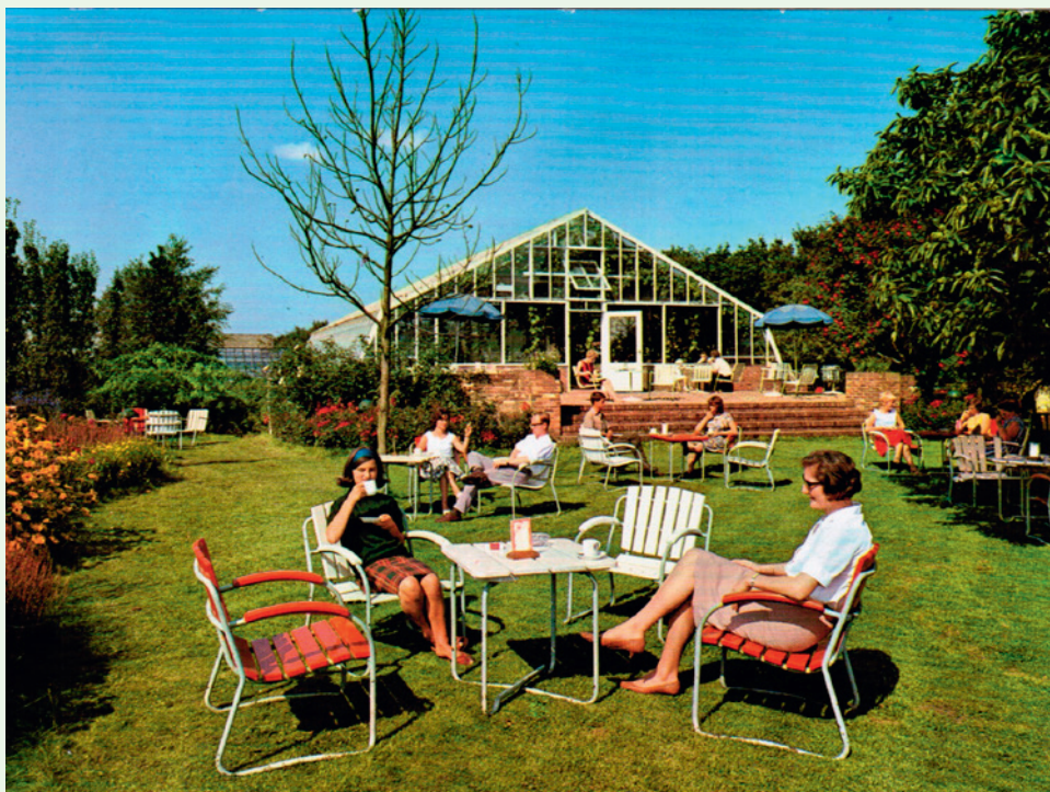
Het terras en de druivenkas van Tomatuva (collectie Historische Kring Eemnes)