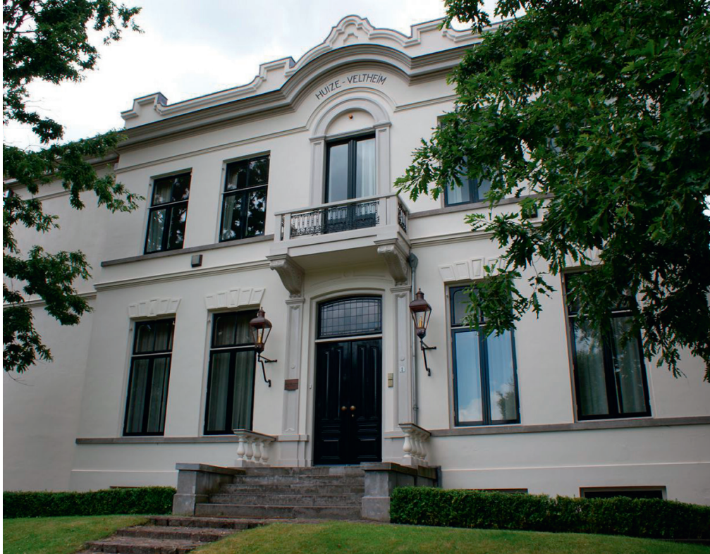
villa Veltheim, vlak na restauratie

Helaas zijn alle oorspronkelijke muurschilderingen bij eerdere renovaties achter verflagen verdwenen. Slechts twee deurpanelen bij de entreehal zijn bewaard gebleven. Aanvankelijk houden vader en zoon Brandts er zelf kantoor, tot hun bedrijf POG Vastgoed BV in 2005 verhuist naar de ook door hen aangekochte en gerestaureerde villa Pera aan de Eemnesserweg 68. Villa Veltheim wordt sindsdien verhuurd aan diverse ondernemingen als kantoor en praktijkruimte. En is nog steeds een waardevol getuige van een rijke Baarnse geschiedenis.