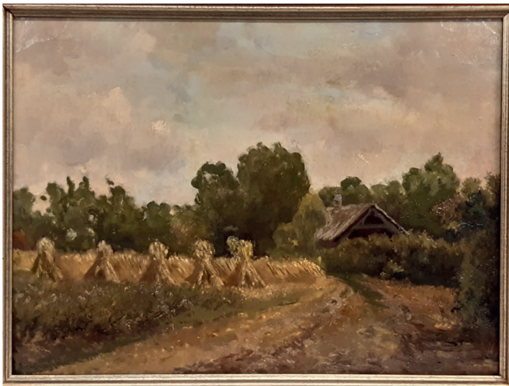
Het 'Zwitserse Huis', voormalig gastenverblijf annex badhuis van Huize Veltheim. Schilderij collectie HKB, geschonken door de heer Ph. Witte, voormalig bewoner van het 'badhuis'.

In het laatste kwart van de 19e eeuw verandert Baarn rap: de opening van de spoorlijn Amsterdam-Amersfoort in 1874 betekent het begin van een nieuw tijdperk met ruimtelijke en sociaal-economische gevolgen: het dorp