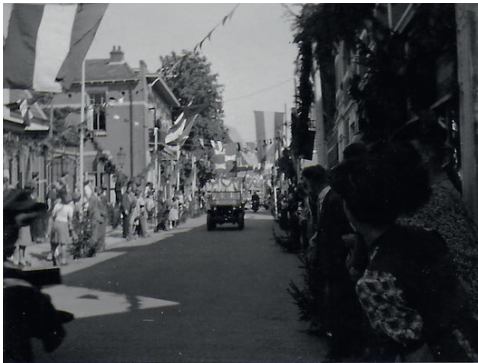
Toejuichen van de bevrijders in de Laanstraat, rechtsonder zit nu lunchroom Uniek

Ik zal nooit de dag vergeten dat de oorlog voorbij was. We moesten voorzichtig blijven want er waren nog steeds overal gewapende Duitsers. Nog geen vlaggen uit dus totdat het echt veilig was. We zagen de eerste Britten pas op 7 mei; we hoorden dat ze er aan kwamen