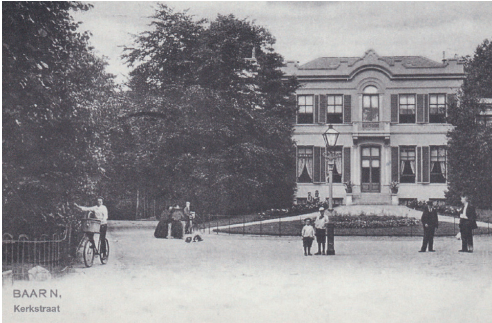
Villa Veltheim in 1900

wordt naar het westen uitgebreid met een vier-tal villaparken in de omgeving van de nieuwe spoorlijn en station. Makelaars en grondspeculanten slaan hun slag. En het verschijnsel van de zomergasten doet zijn intrede. Deze gasten kwamen naar Baarn om te genieten van de rust en het natuurschoon. Vele Baarnaars profiteren van deze ontwikkeling. Pensionhouders en middenstanders doen er hun voordeel mee. Deze ontwikkeling is ook zichtbaar aan de veranderingen die de buitenplaats Veltheim vanaf eind 19e eeuw ondergaat.