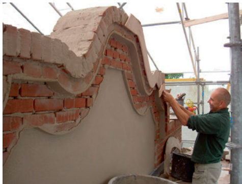
Restauratie metselwerk Villa Veltheim