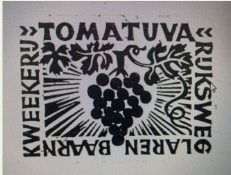
Logo Tomatuva

Langs de Rijksweg bij Eemnes lag jarenlang een populaire uitspanning waar met name in de vijftiger- en zestiger jaren van de vorige eeuw menig gezin op het terras bij de grote druivenkas een ijsje heeft gegeten of een vruchtendrankje gedronken: fruit-restauratie Tomatuva van de heer Herman Pot. In december 1932 had de in het Westland werkzame fruitteler Herman Pot met zijn compagnon een perceel grasland gekocht langs de Rijksweg van Amersfoort naar Amsterdam. Door de aanleg van de Rijksweg 1 in 1928 was de strook grond geïsoleerd komen te liggen en niet meer praktische om op te boeren. Een mooie plek voor een nieuw bedrijf dus. Nog dezelfde maand startte hij met de bouw van een grote druivenkas van 15 x 12 meter die als fruitrestauratie moest gaan dienen. De naam van het bedrijf werd Tomatuva , een samenvoeging van tomaten en uva , het latijnse woord voor druif. De kwekerij en de kas zijn al snel