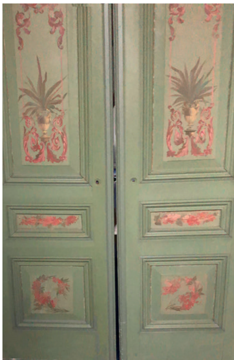
Originele schildering schuifdeuren entree Villa Veltheim