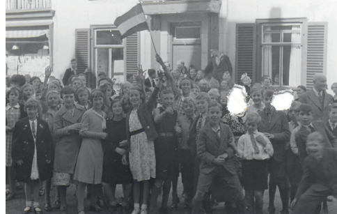
Bevrijdingsvreugde bij de Baarnse jeugd, Laanstraat t.o. het gemeentehuis

Na in 1943 dienst genomen te hebben werd ik getraind voor de genie: bruggen bouwen, communicatielijnen leggen, obstakels uit de weg ruimen. Ik was erbij op D Day, en mijn divisie streed zich langzaamaan een weg door Frankrijk en België naar Nederland als onderdeel van een Canadese divisie, tot de slag bij Arnhem. Pas in april 1945 konden we verder naar het noorden trekken, en op 5 mei was onze victorie compleet: het Duitse leger gaf zich over. Op 7 mei bereikten we Baarn, via Utrecht en Hilversum. De manschappen werden ingekwartierd in het Baarnsch Lyceum, maar het hoofdkwartier (waar ik bij hoorde) werd de eerste twee nachten gelegerd in Paleis Soestdijk, in de garderobe, tot de marechaussee het van ons over zou nemen. We waren namelijk bang dat SS'ers of NSB'ers de boel in de fik zouden steken. De volgende dag zagen we de Duitse troepen hun wapens inleveren terwijl ze voorbij het paleis marcheerden, en ze op een hoop in een nabijgelegen veld deponeerden.