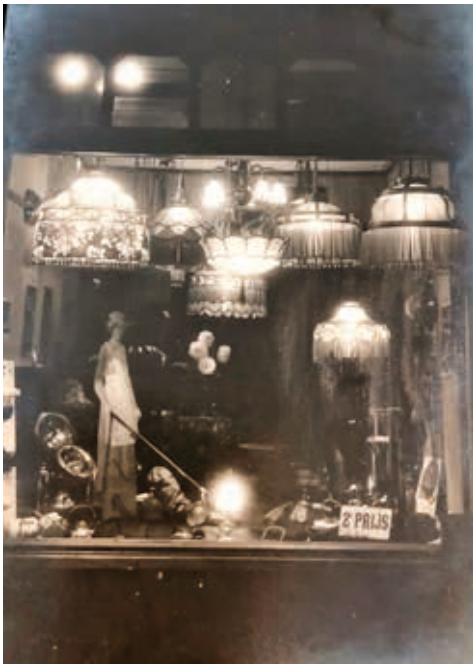
Verlichte etalage van het winkelpand Lengers in de Laanstraat.

Vader trok op met een groepje vrijgezelle vrienden die het avontuur niet schuwden en moeder deed, in die eerste huwelijksjaren, van harte