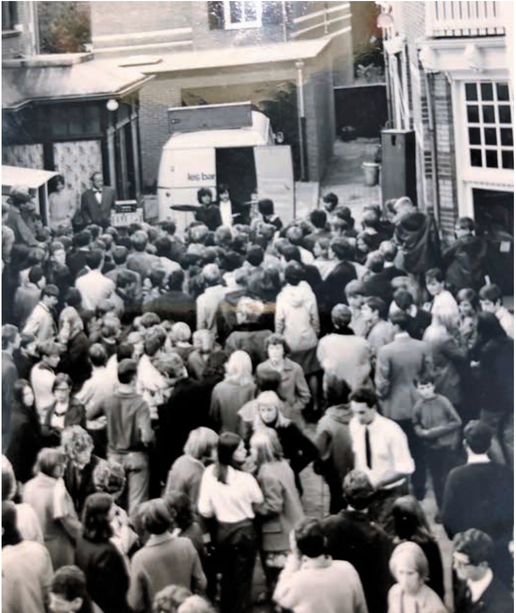
Grote drukte in de Brinkstraat bij het optreden van Les Baroques