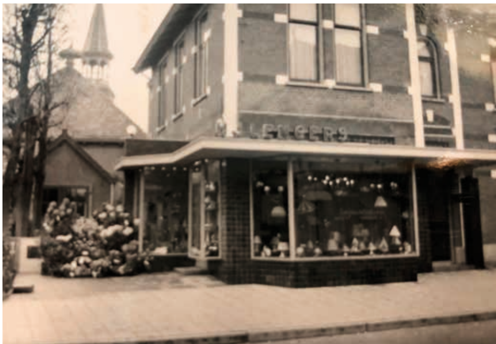
Het verbouwde pand Brinkstraat 29