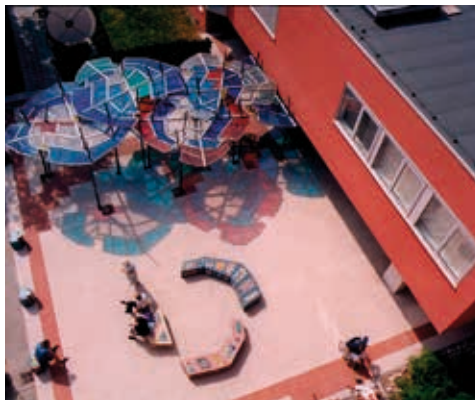
Het kunstwerk van bovenaf, kort na de opening.