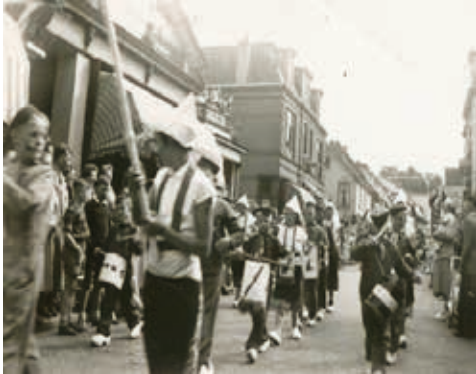
Trommelwedstrijd en optocht in de Brinkstraat