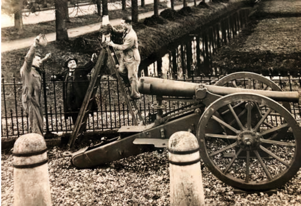
Aanbrengen van feestverlichting bij de Naald ter ere van de verloving prinses Juliana en prins Bernhard

NBS. Ik heb nooit een minderwaardigheidsgevoel gehad en liet niet over me heen lopen. Ik kwam al jong in de grote villa's, als mijn vader mij op de fiets meenam naar klanten. Als enig kind was ik een kleine wijsneus en zat overal bij. Ik speelde ook bij vriendjes in Hoog Baarn. Ik zocht altijd de gezinnen met kinderen op, op zoek naar gezelligheid. Het was toen nog veel meer een standenmaatschappij en daar hoorden ook speciale voorschriften bij. Van mijn ouders mocht ik niet in bepaalde straten of buurten komen, dus liep ik altijd dezelfde weg naar school: via de Brink en de Laanstraat. Ik moest het niet in mijn hoofd halen om bijvoorbeeld in de Burg. Penstraat te komen. Zo ging dat toen. Mijn ouders voedden hun enig