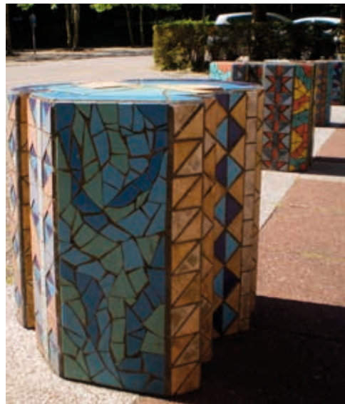
Een aantal zitelementen in 2020.

De mens loopt als vijfde element tussen de vier