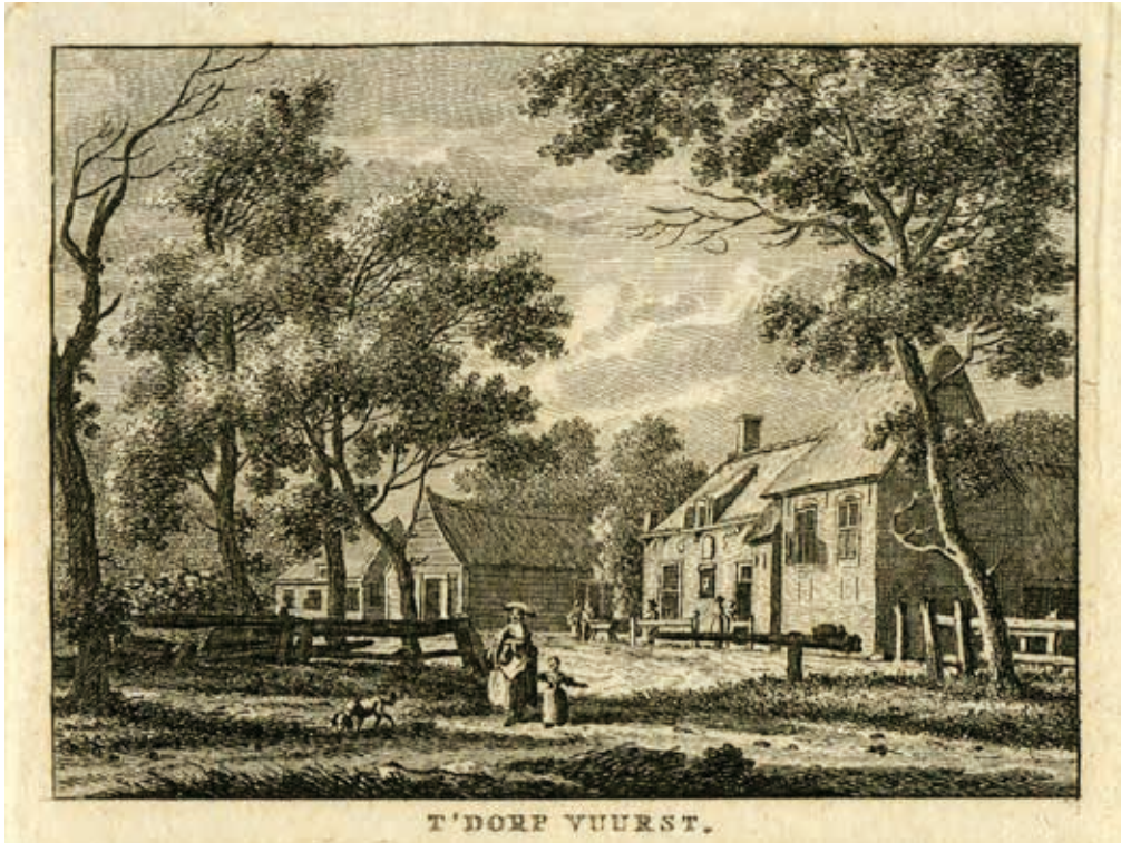
Dorpsgezicht Lage Vuursche met tolboom anno 1788, door graficus K.F. Bendorp naar een tekening van Jan Bulthuis (coll. SGV).

den vast aan het recht van tolheffing. Hadden ze een punt?