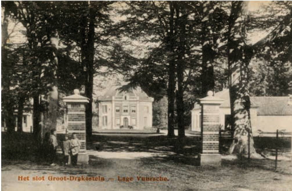
Het huis Drakensteyn te Lage Vuursche, anno 1910.

Het was overigens zeer twijfelachtig of een aanvraag van de jonker zou zijn gehonoreerd. Hoewel de tol winstgevend was - hij hield er in de jaren 1930 gemiddeld f 1.500,- per jaar aan over - kwam dat geld niet ten goede aan het onderhoud van de slecht begaanbare weg. Voor Rijk, provincie en betrokken gemeenten, de Vuursche was inmiddels toegevoegd aan de gemeente Baarn, was de kous daarmee af: voortaan was de Vuursche Steeg tolvrij.