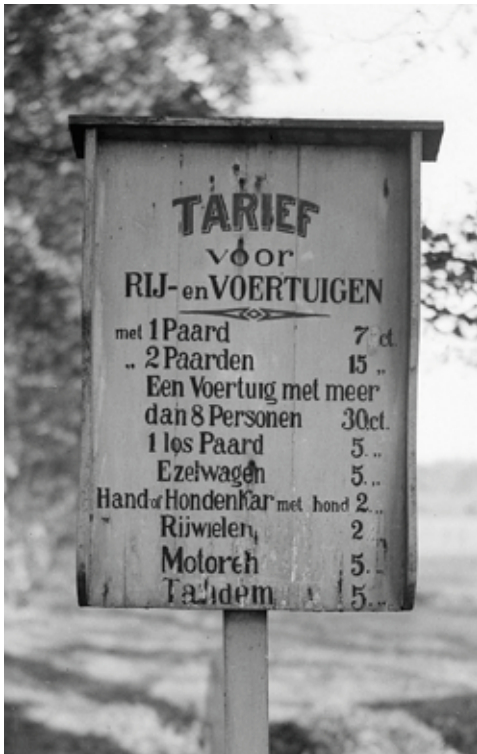
Dit tarievenbord stond bij de tol op de Hilversumse-weg.

Zo gemakkelijk kwam kasteelvrouw Marita de la Concepcion Fernanda Timotea Antonia Sorela y del Corral er na het aan het begin be-