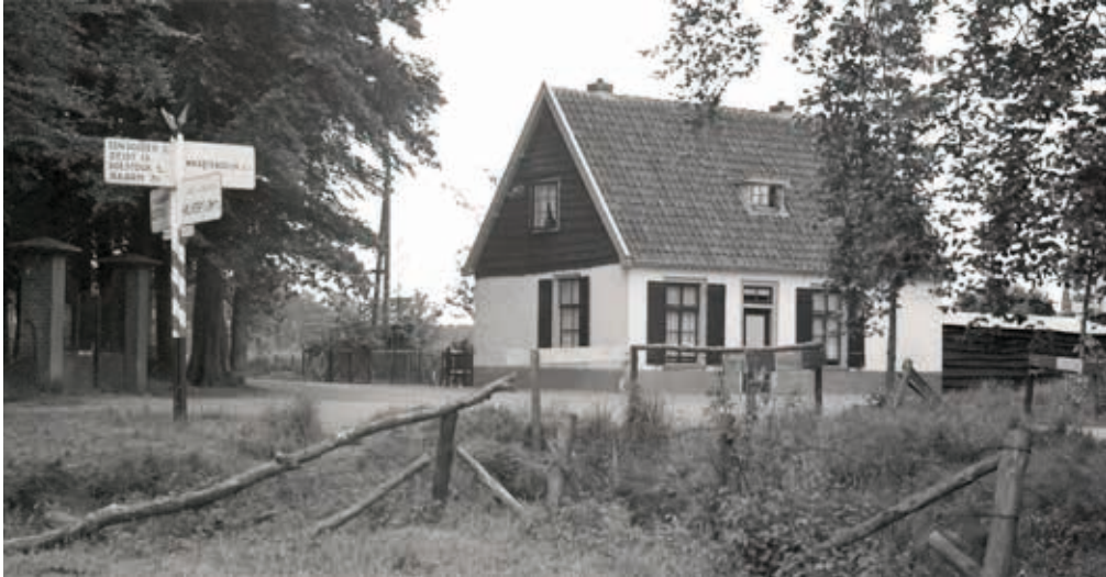
Het tolhuis op de hoek van de Maartensdijkseweg en de Vuursche Steeg, ca. 1950 (coll. RHCVV).

huis op de hoek van de Vuursche Steeg en de Maartensdijkse weg, de zogenoemde 'Tol van Kuus', herinnert nog aan de verwickelingen in het verleden.