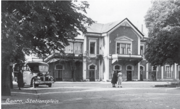
Vlak na de oorlog een Tensenbus links bij station Baarn.

Naast de busdienst van Tensen was er vanaf 1931 ook vanuit Baarn een busverbinding met Bunschoten-Spakenburg. Deze werd verzorgd door de Spakenburgse busonderneming J. Dijkhuizen.