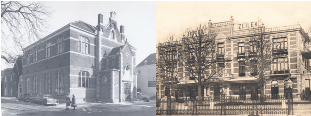
Twee locaties voor VUB-lezingen: het gebouw Elim in de Laanstraat (l) en hotel Zeiler aan het Stationsplein.

Het is heel boeiend om de programma's van de VUB uit de eerste jaren van haar bestaan te vergelijken met die uit het begin van de 21e eeuw, bijvoorbeeld van 2015-2016. In 1947 wilde men proberen om arbeiders en anderen met weinig of nauwelijks scholing - ongeacht hun politieke of religieuze achtergrond - door