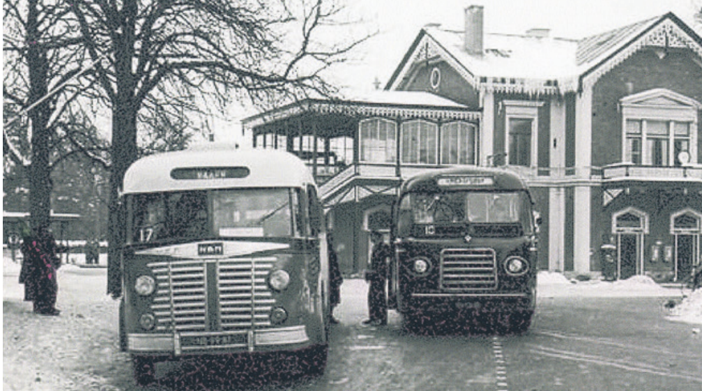
1956: NBM en Tensen bij station Baarn na samenwerking op de rit Baarn-Utrecht.

zamenlijke dagkaarten voor bepaalde gebieden. Er bestonden verder wisselende samenwerkingsverbanden, zoals met bedrijven als Nefkens Amersfoort en de NBM, die niet bij de CAP waren aangesloten.