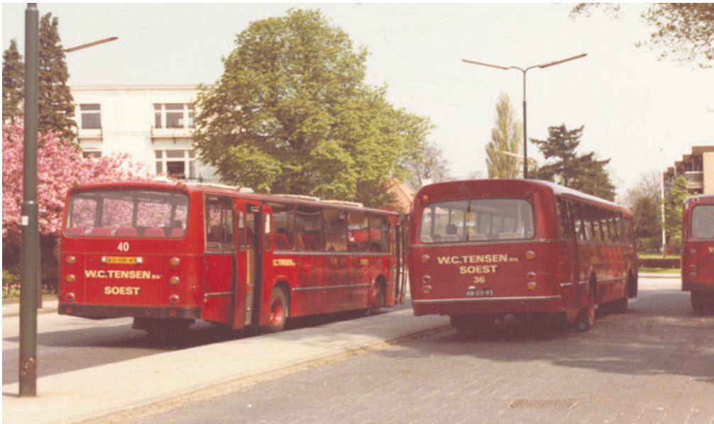
1979: het laatste jaar met rode bussen op het Stationsplein in Baarn.

mee het personeel baanzekerheid werd geboden. De chauffeurs en onderhoudsmedewerkers kregen een functie aangeboden bij de VAD dan wel Centraal Nederland. Verschillende chauffeurs, met name die van de touringcars, kozen ervoor om naar andere ondernemingen over te stappen als De Gooilander (later Beuk). Het vervoersgebied dat door Tensen werd verzorgd werd vanaf 1980 opgedeeld onder Centraal Nederland (CN), de opvolger van de NBM nadat deze gefuseerd was met Maarse & Kroon uit Aalsmeer en de Veluwe Autodienst (VAD) in Apeldoorn. Alle bussen gingen naar de VAD en kregen in de loop van 1980 de gele kleur. Voor Baarn betekende het dat zowel CN als de VAD vanaf station Baarn het busvervoer gingen verzorgen: CN richting Soest en Hilversum, de VAD richting Spakenburg.