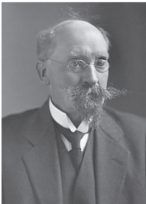
Prof.dr. S.R. Steinmetz in 1919.

nauwelijks scholing - ongeacht hun politieke of religieuze achtergrond - te ontwikkelen. Een volksuniversiteit leek ook hem een goed middel om dat te bereiken. Hij richtte in 1913 in Amsterdam de eerste volksuniversiteit in ons land op, waarbij het hem vooral ging om kennisoverdracht. Steinmetz stelde een program-