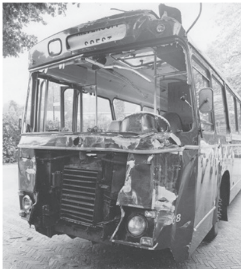
De bus na de aanrijding in 1974.

de overweg slaat de motor van de bus af en Teun krijgt die niet meer gestart. De dieseltank was leeg. Snel iedereen uit de bus. De langsrijdende trein, die natuurlijk volop in de remmen ging, raakt nog net de voorkant van de bus maar sleept deze niet mee. Geen slachtoffers. De schade bleef beperkt tot bus en trein. En de chauffeur werd sindsdien aangesproken als 'Teun Trein'.