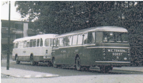
1971: NBM en Tensen bij station Baarn.

Lijn 13 van Baarn naar Pijnenburg bleek een