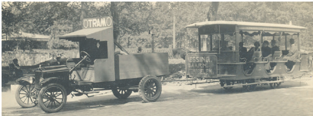
1922-1924: De wagon van de paardentram getrokken door een T-fordje.

van maken, zij kwamen dan vaak lopend vanuit Soest naar dit station bij het Amaliapark. Vanaf 1895 kon hiervoor ook gebruik worden gemaakt van de paardentram, die een verbinding onderhield tussen station Baarn - langs Paleis Soestdijk, hotel Trier, Nieuwerhoek en via de Rijksstraatweg verder tot aan de Oude Kerk - en de remise van de paardentram aan de Torenstraat. In 1898 werd het spoorweganet uitgebreid met een nieuwe verbinding