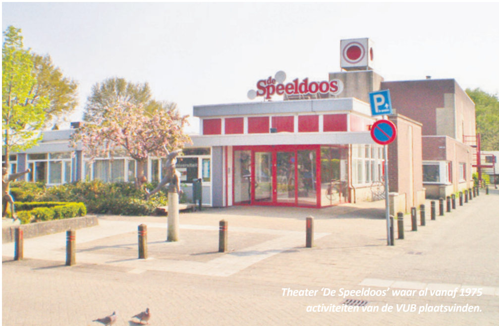
Theater 'De Speeldoos' waar al vanaf 1975 activiteiten van de VUB plaatsvinden.