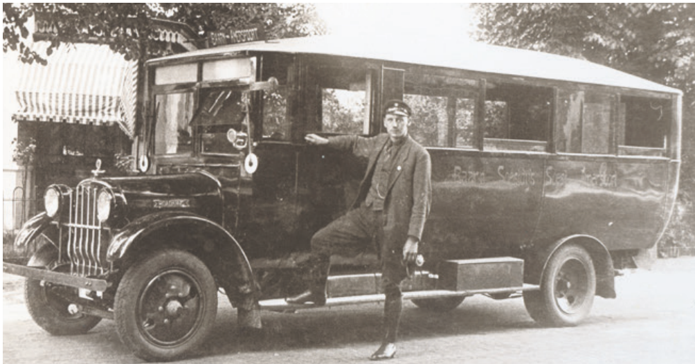
Omtrent 1935: Lijndienstbus Baarn-Amersfoort met chauffeur (coll. Prentenkabinet Soest).

Ook in die tijd had de vervoerder een vergunning nodig, die door de provincie moest worden afgegeven. Al eerder was Van Geerenstein gestart met een busverbinding tussen Soest en Amersfoort. Met de overname van de voormalige paardentramverbinding kon een nieuwe