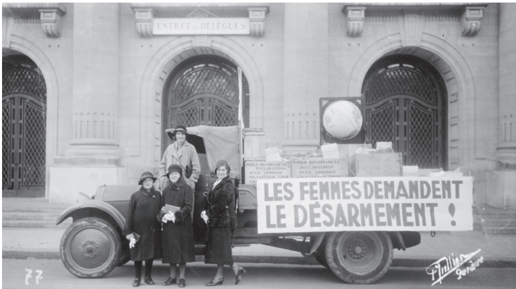
Genève, 1932. Vrachtwagen waarin de handtekeningen werden vervoerd.

De opkomst van het nationaalsocialisme en de op handen zijnde machtsovername in 1933 door Hitler hangt dan al als een dreigende wolk boven Europa en voorspelt weinig goeds voor een Joodse militante feministe en vredesactiviste. Rosa en haar moeder wonen sinds 1932 weer in Amsterdam. Haar vader is in 1931 overleden. En villa Parkwijk is verkocht. In Amsterdam wordt Rosa al snel geconfronteerd met politieke en/of Joodse vluchtelingen uit Duitsland. Via de Vereniging voor Vrouwenbelangen komt ze op voor Duitse feministes en in 1933 wordt ze voorzitter van het dan opgerichte Neutraal Vrouwencomité voor de Vluchtelingen dat zich inspant bij het vinden van werk of toegang tot andere landen voor uit Duitsland gevluchte vrouwen. In 1935 trekt Rosa zich terug als bestuurder van Vrouwenbelangen, de reden hiervoor is niet