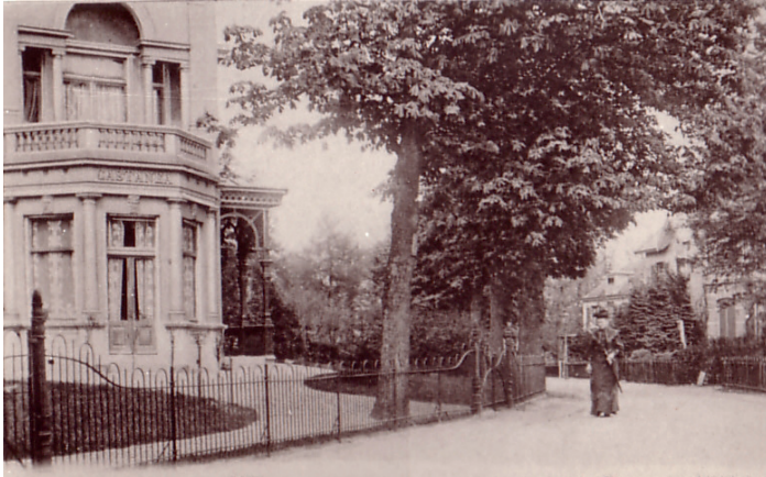
Villa Castanea op de hoek Eemnesserweg/Veldstraat.

klein. Voorzitter Beunk liet bij het 5-jarig jubileum weten dat de boeken zo hoog opgetast moesten worden dat 'de dames' er bijna niet bij konden. Op zaterdagmiddag kwam iedereen nog tegelijkertijd ruilen ook, er was nauwelijks plek om te staan. Het aantal bezoeken aan de twee leeszalen steeg en ook het ledental ging met sprongen vooruit. Jaar na jaar zou blijken dat in Baarn relatief veel mensen lid werden van de bibliotheek. Het aantal leden over de eerste tien maanden van het bestaan bedroeg 328, het aantal jeugdleden 77. 2