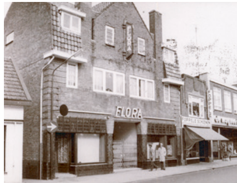
Laanstraat in de jaren 1960 (coll. HKB).

De kunsthandel van Crets zat er dus in die tijd, net als kapper Manifarges en kledingzaak Magneet. Drankwinkel Jansen en Bensdorp snoep. Foppele Schoenen, Albert Heijn en twee dames die een winkeltje hadden waarvan Jaap eigenlijk geen idee meer heeft van wat ze verkochten Het zijn de winkels die in de jaren vijftig, zestig het deel van de Laanstraat vulden rond wat nu het Floraplein wordt genoemd. Inderdaad, genoemd naar de bioscoop. En de Laanstraat was nog een straat waar je met de auto doorheen kon.