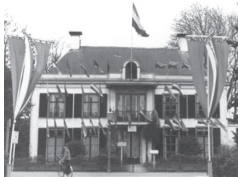
Eemnesserweg 1, villa Lommeroord.

De bibliotheek gebruikte aanvankelijk twee kamers in de oude villa van notaris Van Ditzhuyzen, villa Lommeroord op Eemnesserweg 1. De ruimte was al snel te