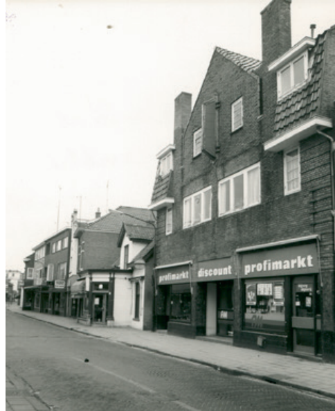
De Profimarkt aan de Laanstraat.

Jaap Visser en prins Bernhard konden het prima met elkaar vinden. De prins belde Visser geregeld vanuit het paleis: of Jaap een stukje