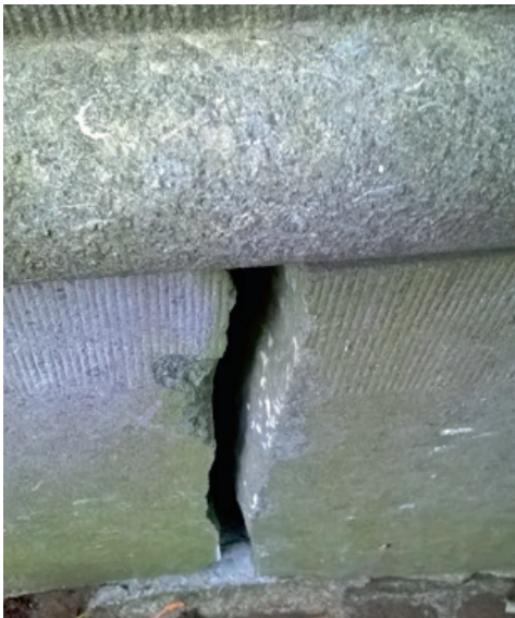
De geconstateerde scheur.

Toen wij onze collega's van de Nieuwe Begraafplaats daarover raadpleegden luidde