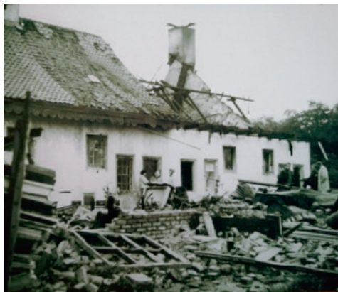
De Zes Woningen na de verwoestende brand. Op de voorgrond de restanten van de houten schuren, waar de brand begon.

Vriendjes en vriendinnetjes van school kwamen nooit spelen - te ver weg - maar gelukkig waren er buurkinderen van dezelfde leeftijd. Ze hadden genoeg te beleven. Verstoppertje spelen, cantharellen zoeken, hutten bouwen, de klimboom in of schaatsen op de Bananenvijver bij de Blauwe Koepel. En als we moesten eten floot vader op zijn vingers.