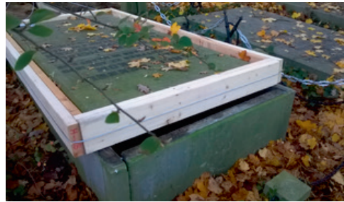
10 cm ontsluiting.

Een blik in de nu dakloze grafkelder zelf werkt wel enigszins ontvullend: het is er een gro-