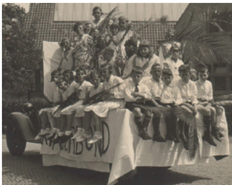
Corsowagen van de Kinderbond in 1933 bij het 10-jarig bestaan van School- en Werktuinen.