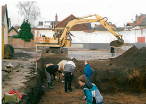
1990 - Opgravingsput op parkeerterrein C1000.

Eind november 1988 werd door de raad van de gemeente Baarn een voorbereidingsbesluit genomen voor het wijzigen van een gedeelte van het bestemmingsplan Centrum om de uitbreiding van de C1000-supermarkt moge-