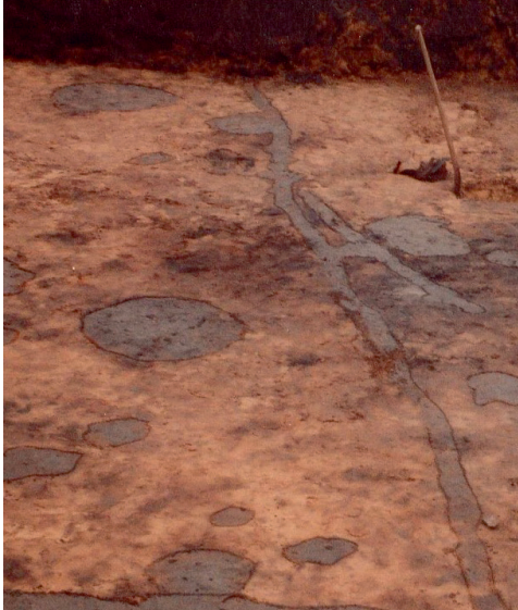
Sporen van de erfafscheiding van de boerderij.

ARWE toestemming om onderzoek te doen. Voorafgaand aan de geplande uitbreiding aan de achterzijde van de winkel, werd een onderzoekput van enkele honderden vierkante meters opengelegd. Dit kon na een donatie van f 1000 van de Maatschappij van het Nut en met medewerking van de firma Rijkeboer die belangeloos een hydraulische kraan ter beschikking stelde. In de onverstoorde bodem werden de grondsporen van een bootvormige boerderij uit de 12e eeuw aangetroffen, waarvan de maten ca. 7 x 23 m waren.