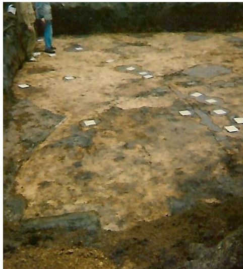
Paalsporen van de middeleeuwse boerderij.

van Siegburg-aardewerk, 15e eeuw, en fragmenten van kleipijpen uit de 17e en 18e eeuw gevonden. De oudste vondsten wijzen weer op een nederzetting in de onmiddellijke nabijheid van de opgravingen, vooral de hak- of spitsporen wijzen op een soort moestuin of akker dichtbij de bebouwing. Nu bevestigd is dat in het gebied tussen de Laanstraat en Leestraat bewoning is geweest, is het van groot belang dat bij graafwerkzaamheden in dit gebied de mogelijkheid wordt geboden voor verdere waarnemingen en opgravingen.