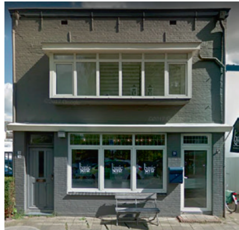
Leestraat 26 in 2018.

De vergaderingen van de commissieleden werden maandelijks ten huize van de presidente gehouden. Naast algemene punten konden ook opvoedkundige onderwerpen worden besproken, bestudeerd of gelezen. Ook werden