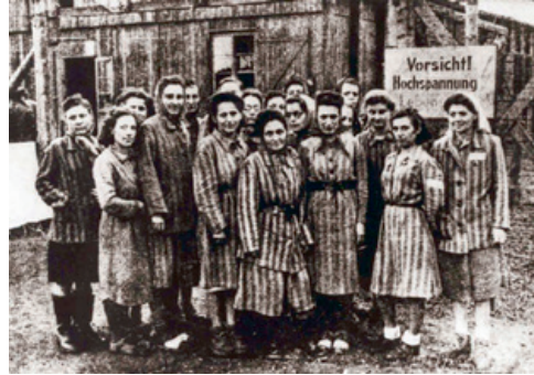
Vrouwen in het kamp Ravensbrück

Willemijn werd vanuit het Oranjestad hotel in Scheveningen naar kamp Vught gevoerd. Intussen rukten de geallieerden op. Op 5 september 1944 was het kanongebulder al in het kamp te horen. Gedurende deze 'Dolle Dinsdag' hoopten de gevangenen dat ze snel bevrijd zouden zijn, maar de bevrijding zou nog op zich laten wachten. Wel zorgde de opmars van de geallieerden voor veel paniek bij de Duitsers. Er werden gevangenen gefusilleerd. Je kon aan het aantal genadeschoten horen hoeveel mensen er doodgeschoten werden. Willemijn vertelt: Wij hoorden het schieten. Willekeurig doodden ze mannen, onder wie Piet Krol. En de kleren van die man-