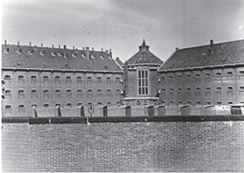
Het Oranjestad hotel in Scheveningen