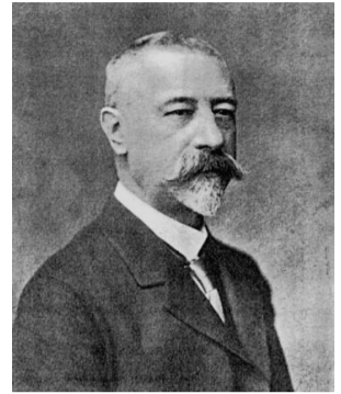
De heer v/d Honert van de Deli Maatschappij

Vanaf de oprichting van de IJzeren Spoorweg vanuit Amsterdam in het jaar 1874 vestigden globetrotters en forenzen zich in Baarn. Bijvoorbeeld een reder woonachtig in de Eemstraat, die wel vijf verschillende stoomvaartmaatschappijen oprichtte. En een collega van hem uit de Ringlaan, die binnen enkele jaren in de tropen een scheepvaartmaatschappij oprichtte, compleet met een groot aantal vestigingen. Aan de Zuiderlaan woonde een tabaksplanter, die misschien wel een van de eerste was die probeerde de slavernij en Nederlands Indië af te schaffen een ook nog aan sociale woningbouw in Amsterdam deed. Deze en andere Baarnse globetrotters en forenzen zijn onderwerp van de diapresentaties.